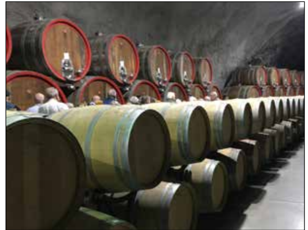
Vingården Šipčanik söder om Podgorica lagrar vinet i en tidigare hemlig jugoslavisk flyghangar.