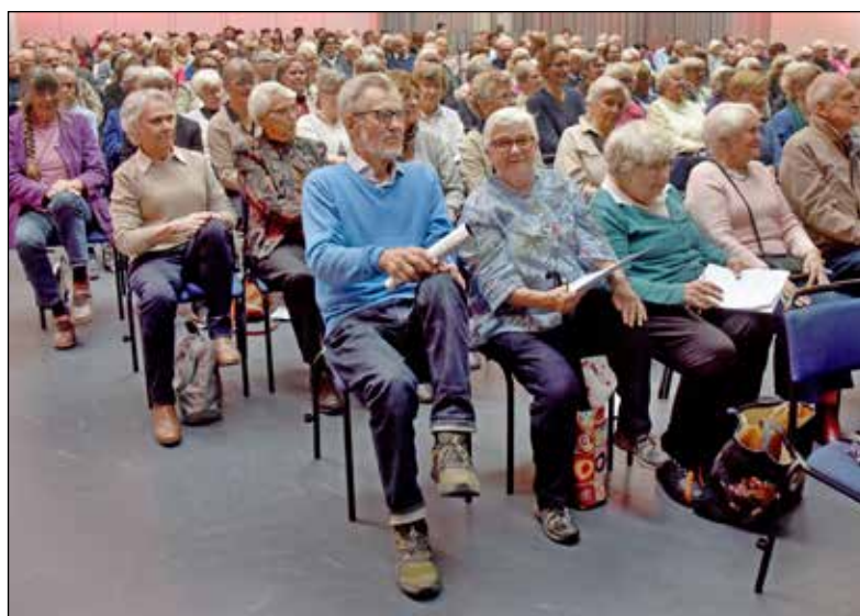
För att ingen skulle stelna till av allt sittande, var det lite pausgympa med Friskis och Svettis mellan föredragen.