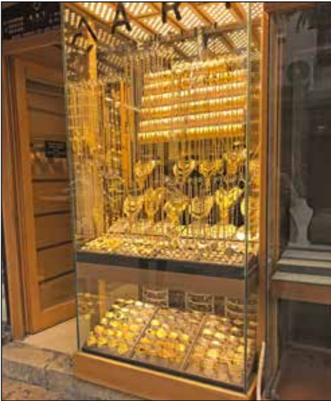
På en av gatorna i Skopje låg guldsmedsaffärerna vägg i vägg med exklusiva tygbutiker.