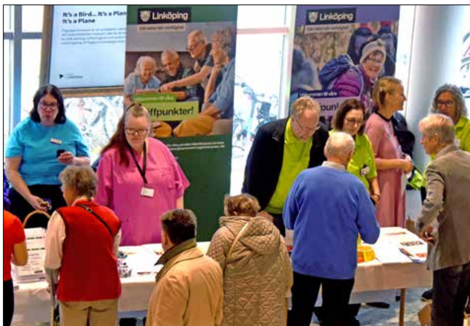
Linköpings kommun som arrangerade Seniordagen var naturligtvis där och berättade om Vård- och omsorgsnämndens arbete.