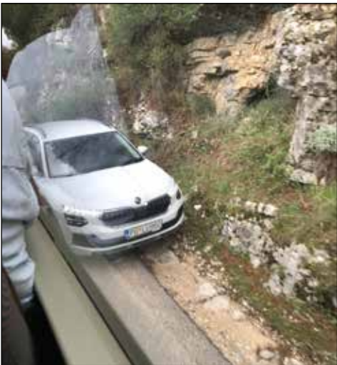
En smal väg med hårnålskurvor fick en mötande bil att köra nära berget.