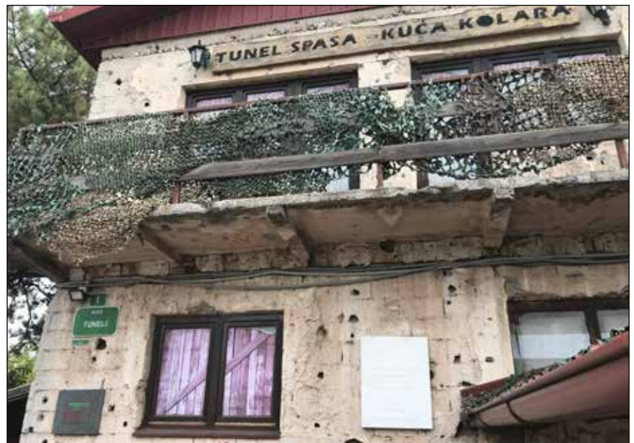
Tunneln som försåg Sarajevoborna med förnödenheter började i källaren på det här huset.

en mörk och mysig vandring genom staden längs en brygga till en genuin restaurang. Vistelsen var en av resans absoluta höjdpunkter.