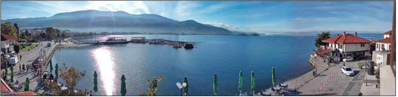
Den mysiga nordmakedonska staden Ohrid ligger vid Ohridsjön som är upp till 300 m djup.