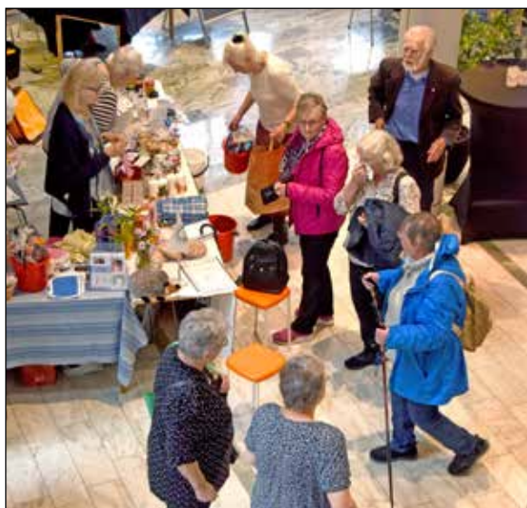
Många föreningar och företag passade på att visa upp sig under Seniordagen.