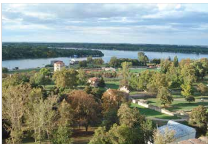
Från höjden vid fortet i Belgrad ser man hur floden Sava rinner ut i Donau.

Nordmakedonien , det femte och sista landet på resan, nåddes efter en skakig bussfärd på en riktigt dålig väg. Vårt mål var Ohrid, en stad i sydvästra delen av landet, vid Ohridsjön. Det var en underbar plats som mötte oss med sol och värme. Här njöt vi av de pittoreska omgivningarna, en båtfärd på sjön,