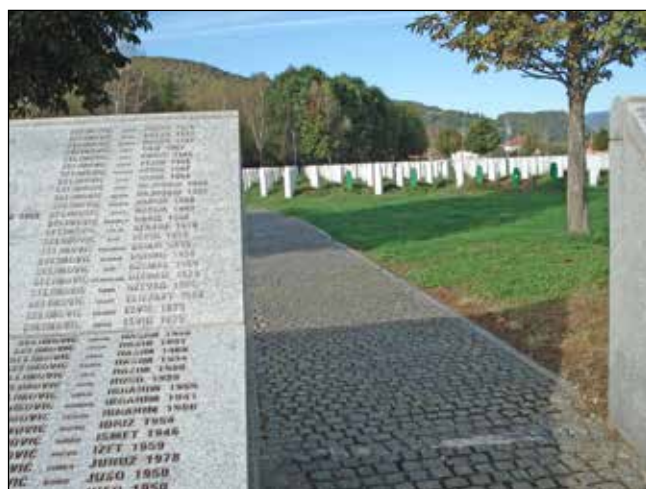
En vacker minnesplats över de 8 372 bosniaker som avrättades i Srebrenica.